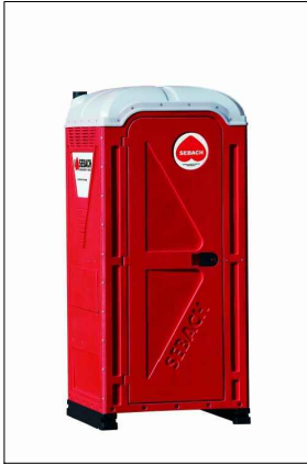
Bagno chimico portatile, dimensioni 1100x1100 mm h=2300 mm