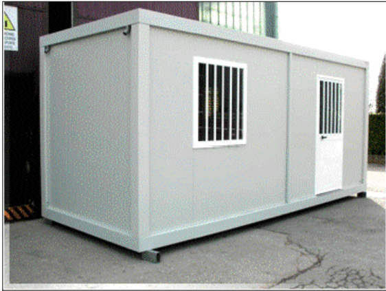
Baracca di cantiere, prefabbricato modulare componibile ad uso mensa, ufficio e spogliatoio, dimensioni 6000x2460 mm h=2700 mm