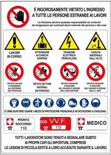
Cartello di cantiere N.1 fisso per tutta la durata dei lavori